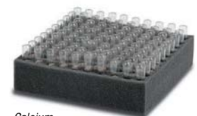
Calcium Carbide ampullen

In combinatie met deze kwaliteit CM-koffer is de handige capaciteits vochtmeter T 650 uit de Trotec Multi-Measure serie aan te bevelen. Met deze vochtmeter kan snel en eenvoudig gedetecteerd worden waar zich de grootste vochtconcentratie bevindt.