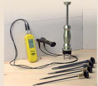
Optioneel leverbaar: TS-adapterset (2) en TC 25-aansluitkabel (3) voor aansluiting van de elektroden uit het MultiMeasure-assortiment voor de T500